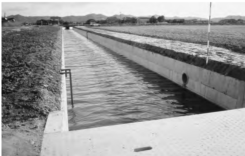
(児島湾土地改良区)