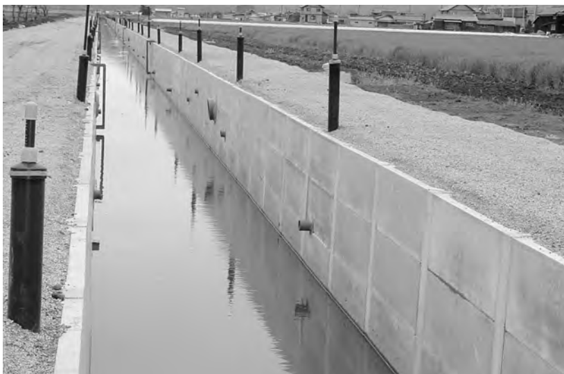
(児島湾土地改良区)