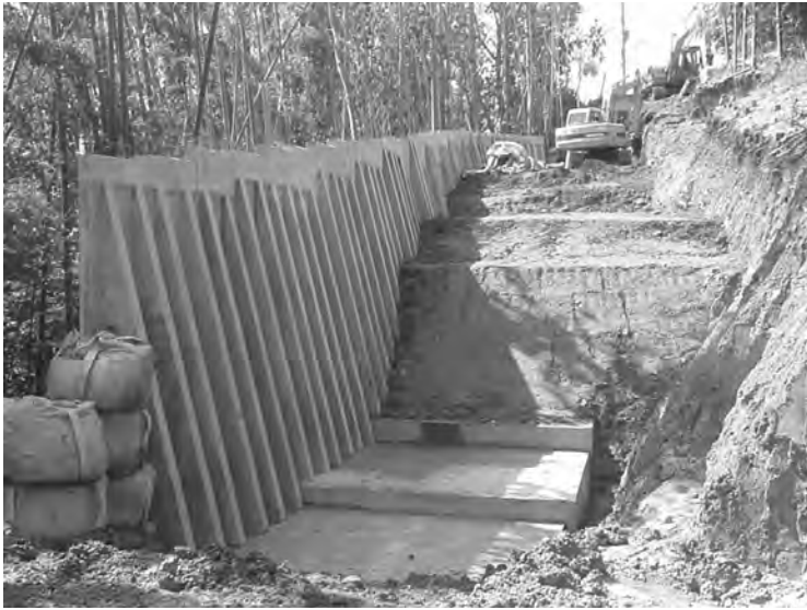
奈義町役場（小谷線）