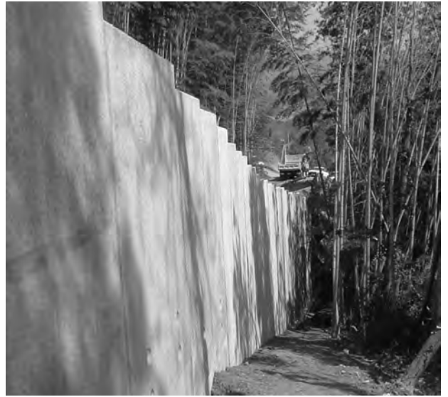
奈義町役場（小谷線）