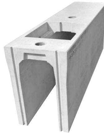
長さ1.1m以上の役物対応(開口付)暗渠型