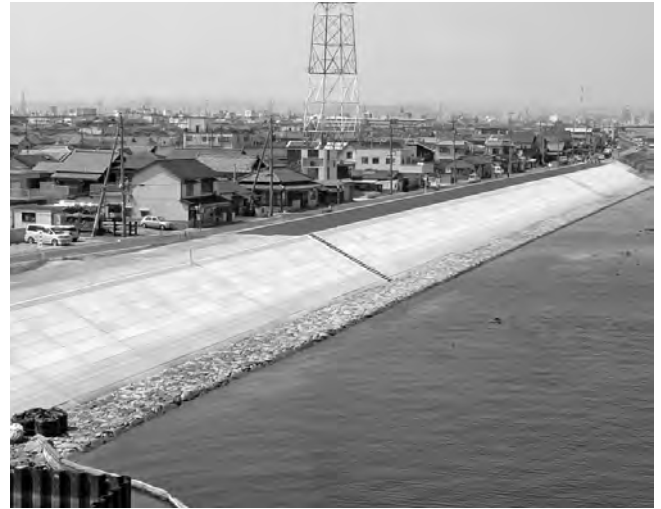
国交省 岡山河川事務所 (旭川)