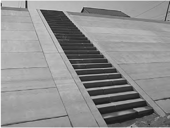
国交省 岡山河川事務所（旭川）