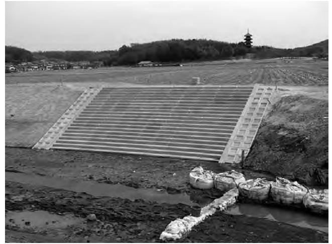
備前県民局（総社市内）