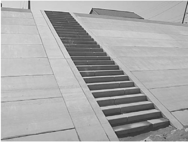
国交省 岡山河川事務所（旭川）