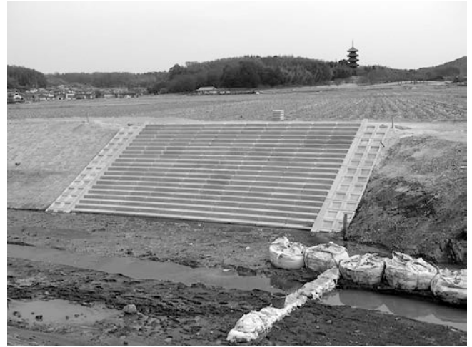
備中県民局（総社市内）